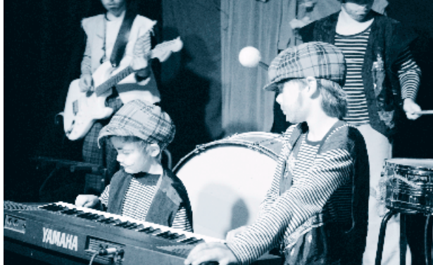
Momentaufnahme der Zirkuswoche auf dem Twannberg

Dieses Jahr wurde eine wiederholte Weihnachtsaktion durchgeführt dank dem grosszügigen Beitrag von CHF 16'700.– der Winterhilfe Schweiz. Berücksichtigt werden konnten die regionalen Winterhilfe-Stellen (siehe dazu auch Seite 15) Langnau, Köniz, Ostermundigen sowie die kantonale Winterhilfe. Die vielen freudigen Dankesbriefe der 49 beschenkten Familien sprechen für sich.