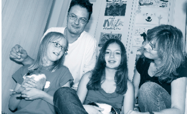
Ausschnitte aus dem Leben von Gesuchs- stellenden