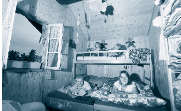
Ausschnitte aus dem Leben von Gesuchs- stellenden

Die regionalen Winterhilfe-Stellen im Kanton Bern führen eigene Sammlungen durch und verwalten die Gelder in Sinne der Richtlinien der Winterhilfe autonom. Sie sind verpflichtet, Abrechnungen von ihren Sammlungen zu Handen der Winterhilfe Kanton Bern zu erstellen und ein Drittel des Sammelertrages der Winterhilfe Kanton Bern zur Verfügung zu stellen sowie 4,5% zu Gunsten der Winterhilfe Schweiz.