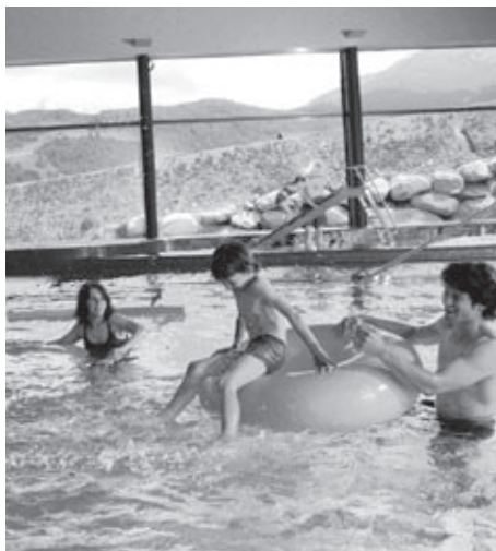
Unbeschwerte und erholsame Ferien für Familien und Alleinerziehende: Reka und die Winterhilfe machens möglich.

In Ergänzung zu den kantonalen Sammlungen führte der Zentralverband, wie seit vielen Jahren üblich, einen adressierten Versand durch. Dieser erfolgte Ende November 2005 an 169'000 Haushaltungen in der ganzen Schweiz und erbrachte ein erfreuliches Ergebnis von CHF 616'841.39. Davon flossen CHF 391'385.20 an die Kantonalorganisationen zur Finanzierung ihrer Unterstützungstätigkeit. Um die Leistungsfähigkeit der Adressverwaltung zu erhöhen und die Sammlungen effizienter abzuwickeln, wird die Datenbank des Zentralsekretariates (Clearlook) überarbeitet und zielgerichtet weiterentwickelt. Dank einer Terminal-Server-Lösung wird es künftig möglich sein, auch von externen Arbeitsplätzen auf die Datenbank des Zentralsekretariates zuzugreifen. Damit können die Kantonalorganisationen von einer gemeinsamen, leistungsfähigen Datenbanklösung profitieren und wird der Datenabgleich zwischen den Kantonalorganisationen und dem Zentralverband entscheidend erleichtert. Inzwischen verwaltet das Zentralsekretariat neben ihren eigenen, insgesamt 180'000 Adressen von Spenderinnen und Spendern, Medien, Birnel-Verkaufsstellen, Mitgliedern, Mitarbeitern, die Spenderdaten von fünf Kantonalorganisationen und mehreren Bezirksstellen des Kantons Zürich.