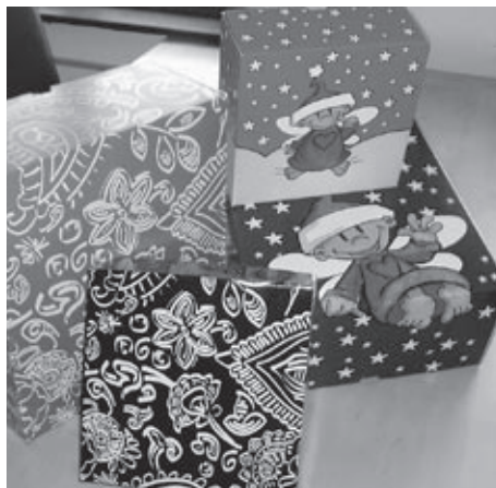
Alle Poststellen verkaufen für die Winterhilfe während der Adventszeit wunderschöne Weihnachtsboxen für Kinder und Erwachsene.

Zudem regelte die ZEWO den Status von kantonalen und regionalen Unterorganisationen genauer. Neu muss die Winterhilfe Schweiz die Einhaltung der ZEWO-Kriterien durch die Kantonalorganisationen sicherstellen. Um die Kantonalorganisationen bei der Erfüllung der ZEWO-Bestimmungen und insbesondere bei der anspruchsvollen Umstellung auf Swiss